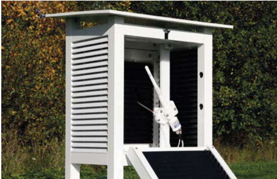
HMP155 配有稳定的新型HUMICAP® 180R 传感器和一个附加的温度探头。